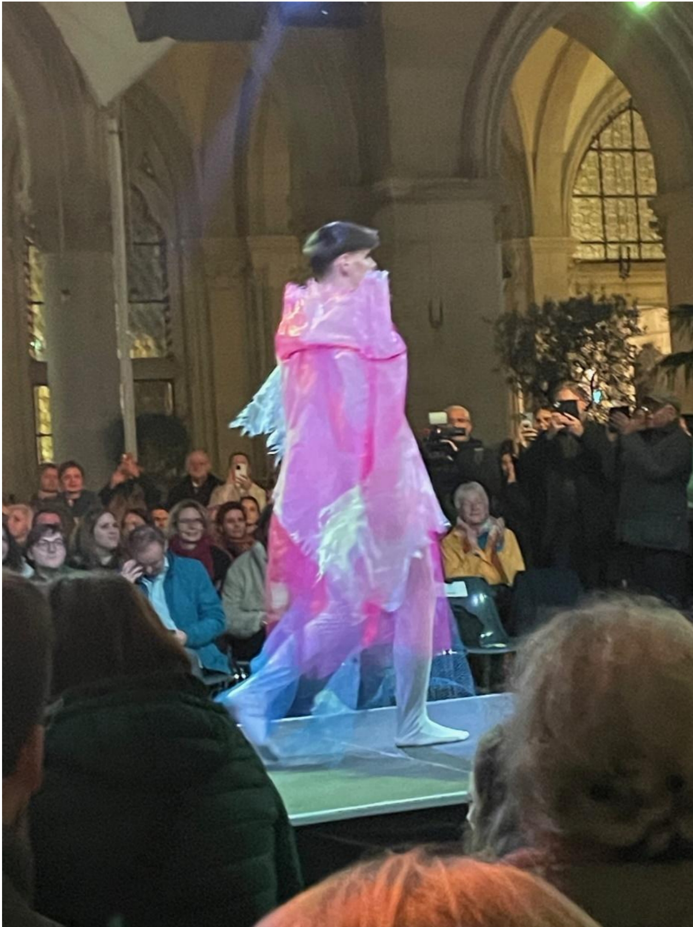
Modell von Leopold Kauc, 3B