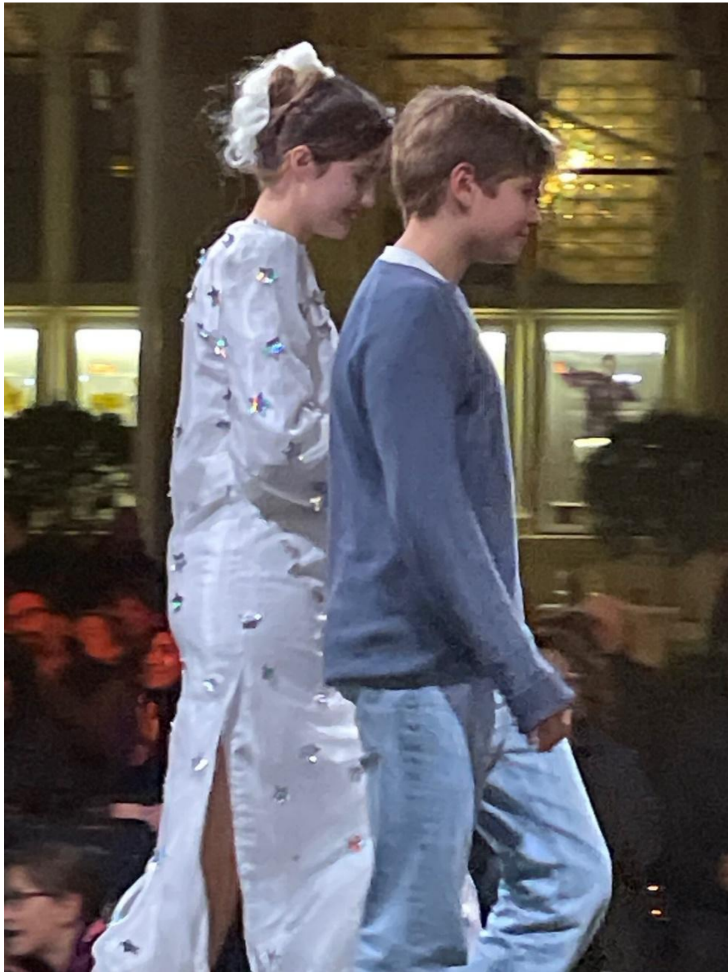
Modedesign von Jonathan Katzmaier, 4C